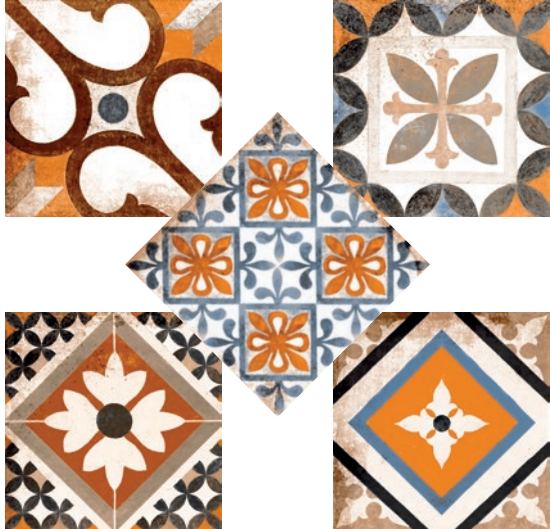
Murcia Marrón Mat 20x20cm