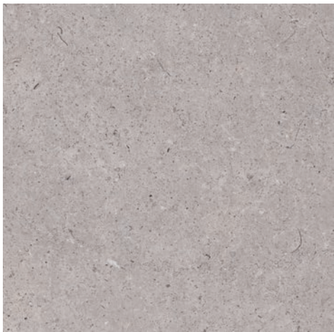
Antares Gris Mat 61x61cm