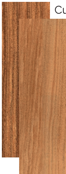
Cumarú Teca Mat 20x66cm