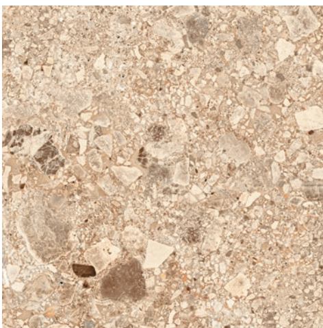
Acrux Beige C2 61x61cm

Antideslizante Clase 2 para aplicaciones exteriores