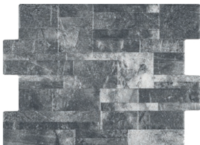
Elda Gris Mat 36x50cm