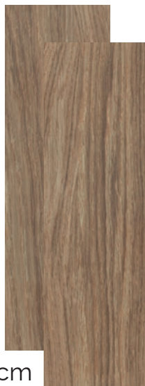
Sequoia Encino Mat 20x66cm