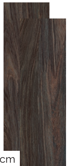
Sequoia Habana Mat 20x66cm