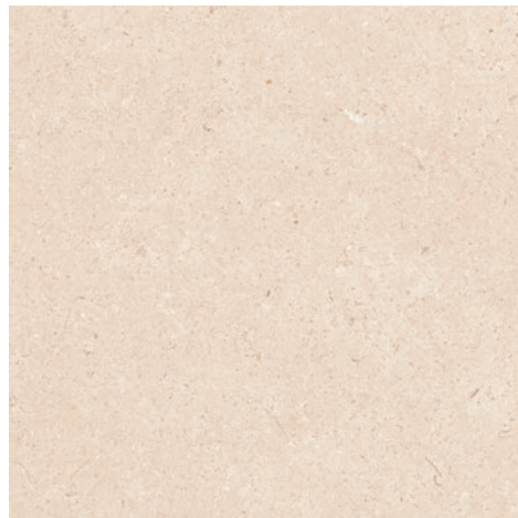
Antares Beige Mat 61x61cm