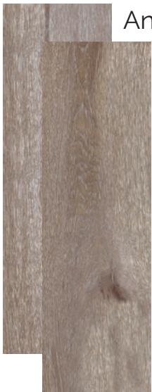
Angola Gris Mat 20x66cm