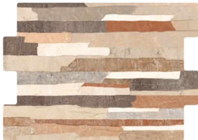
Alpes Mix Mat 36x50cm