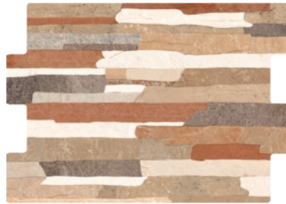
Alpes Mix Br 36x50cm