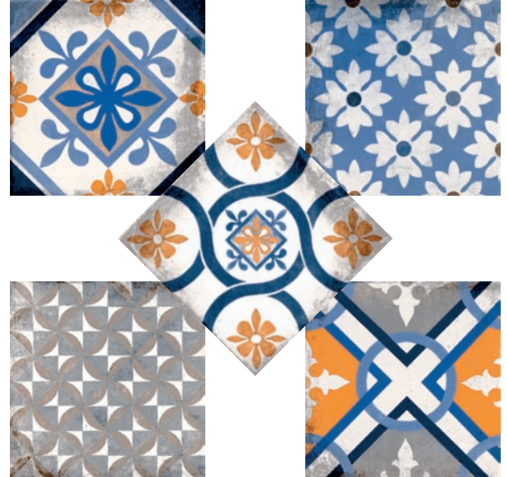
Murcia Azul Mat 20x20cm